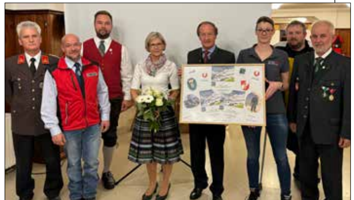
28.10.2023: Feier mit Abordnungen der Vereine der Gemeinde