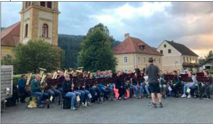
15.09.2023: Probe des Musikvereins und Freibier beim Hallenbad

ne langjährige Amtszeit und hob dabei ganz spezielle und wichtige Projekte für unsere Gemeinde hervor. Für das stets gute Gesprächsklima, die gute Zusammenarbeit und das konstruktive Miteinander sprach er all seinen Weggefährten ganz großen Dank und Anerkennung aus. Aber auch in Richtung Land Steiermark richtete er aufgrund der jahrelang gewährten Unterstützung ein großes Dankeschön. Und nicht zuletzt bedankte er sich ganz herzlich bei seiner Familie für die tolle Unterstützung, das Verständnis und den ständigen Rückhalt. Bewegende Ansprachen, Dankesworte und Standing Ovationen begleiteten unseren scheidenden Ortschef in die verdiente Bürgermeisterpension.