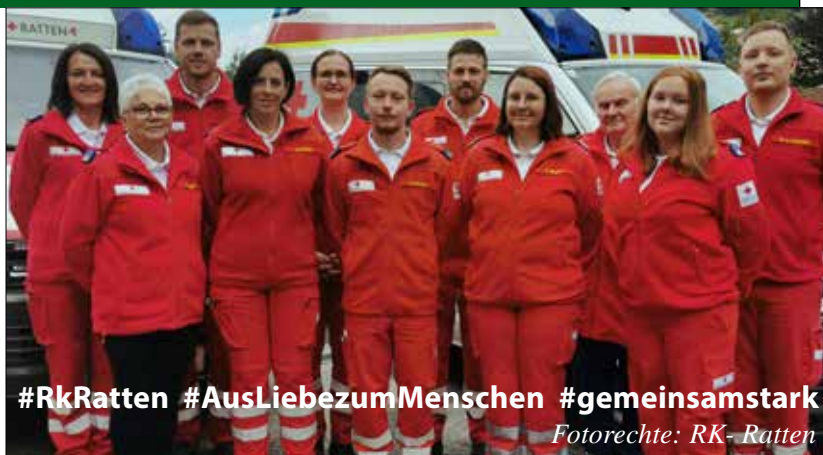
#RkRatten #AusLiebezumMenschen #gemeinsamstark

Das gesamte Team der Rot Kreuz Ortsstelle Ratten wünscht allen Bewohnerinnen und Bewohnern in unserem Ausfahrtbereich ein frohes Weihnachtsfest sowie ein erfolgreiches Jahr 2023.