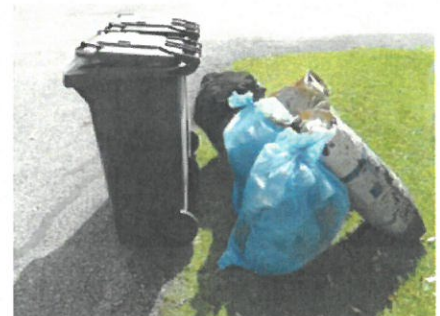
Bitte keine zusätzlichen Säcke neben den Behältern platzieren. Diese werden nicht mitgenommen.