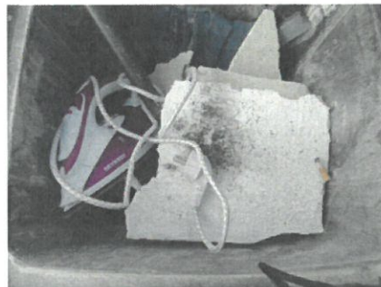
Elektrogeräte sind gefährliche Abfälle und müssen im ASZ entsorgt werden!