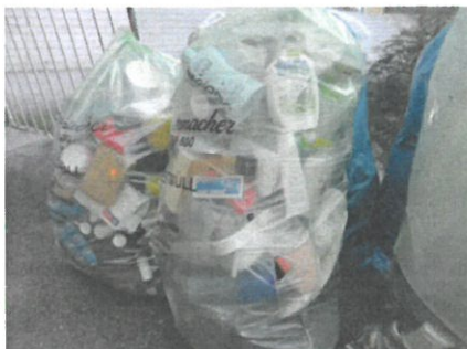
Der häufigste Fehlwurf: Leichtverpackungen für den Gelben Sack

Bei unsachgemäßer Entsorgung von Abfällen über den Restmüll, sind deren Rohstoffe für ein weiteres Recycling verloren. Durch korrekte Trennung können diese jedoch als Sekundärrohstoff für neue Produkte wiederverwendet werden.